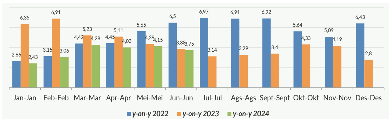
Gambar 1 Tingkat Inflasi Year on Year (y-on-y) Kota Sibolga bulan Juni, 2022–2024 (Persen)